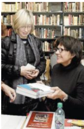
SIGNERING: Kjøpere i kø på Lillehammer bibliotek.

– Men det er ikke for å fortelle om de såkalte «bragdene» mine jeg har skrevet boka. Det jeg vil fortelle er at det er viktig og bra å ha med seg noe i bagasjen. Noe