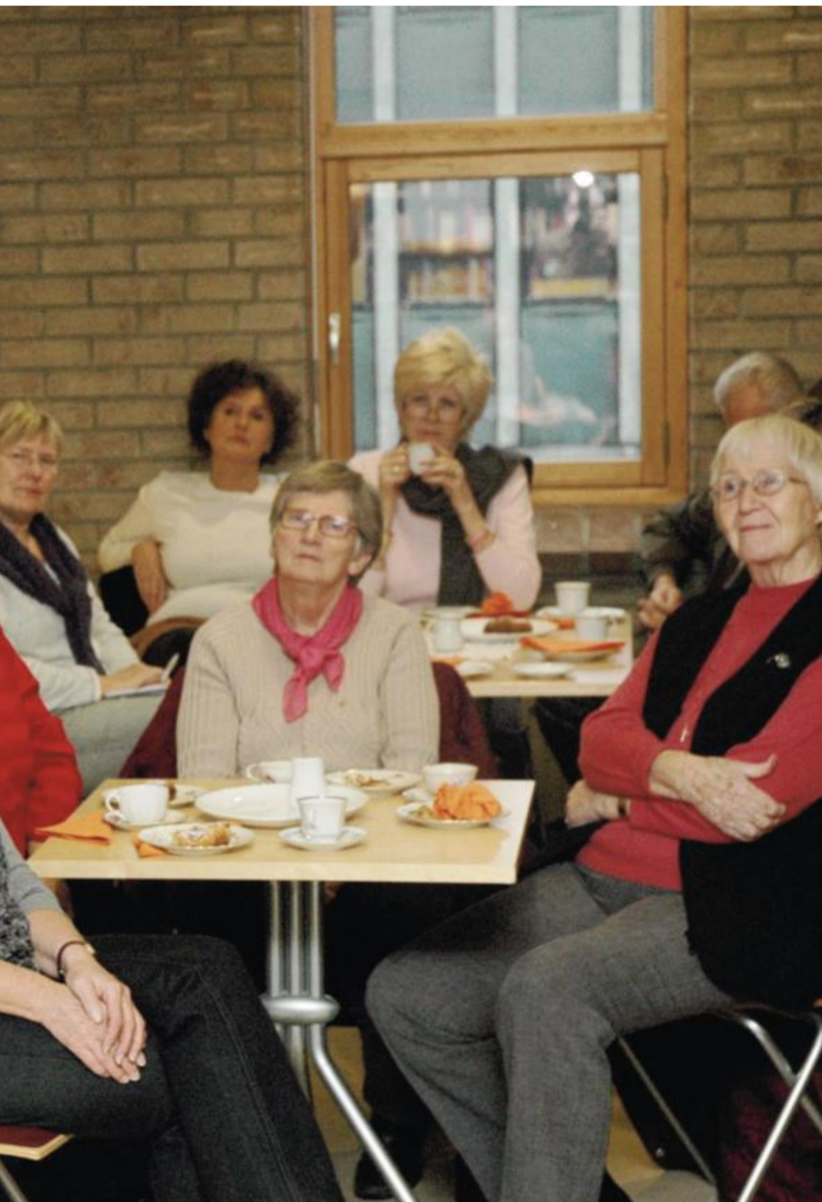
torsdag. Her forteller hun om boka si «Til Sydpolen – ingen bragd», hvordan den ble til, hensikten med å skrive den.